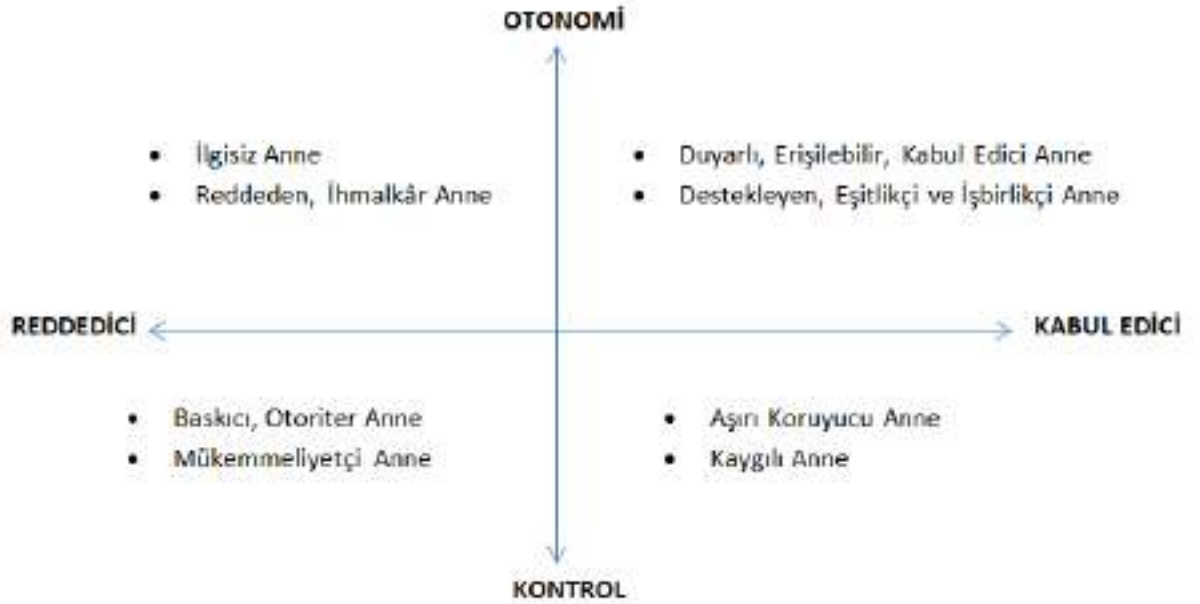
Şekil 1: Anne Tutumları

Şekil 1'e göre otonomi ve reddedici özellikleri baskın olan annelerin ilgisiz ve ihmalkar olduğu; otonomi ve kabul edici annelerin duyarlı, erişilebilir, çocuğunu destekleyen ve eşitlikçi bir tutum sergilediği söylenebilir. Kontrol eden ve reddedici özellikler sergileyen annelerin baskıcı, otoriter ve mükemmeliyetçi olduğu; kontrol edici ve kabul edici olan annelerin ise kaygılı ve aşırı koruyucu anneler olduğu görülmektedir.